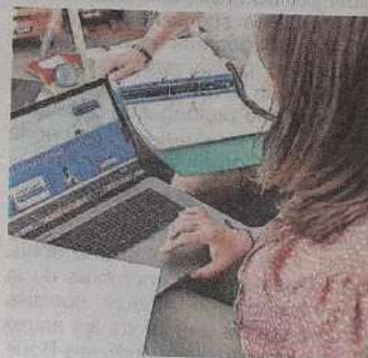
34 millions de propriétaires sont concernés.