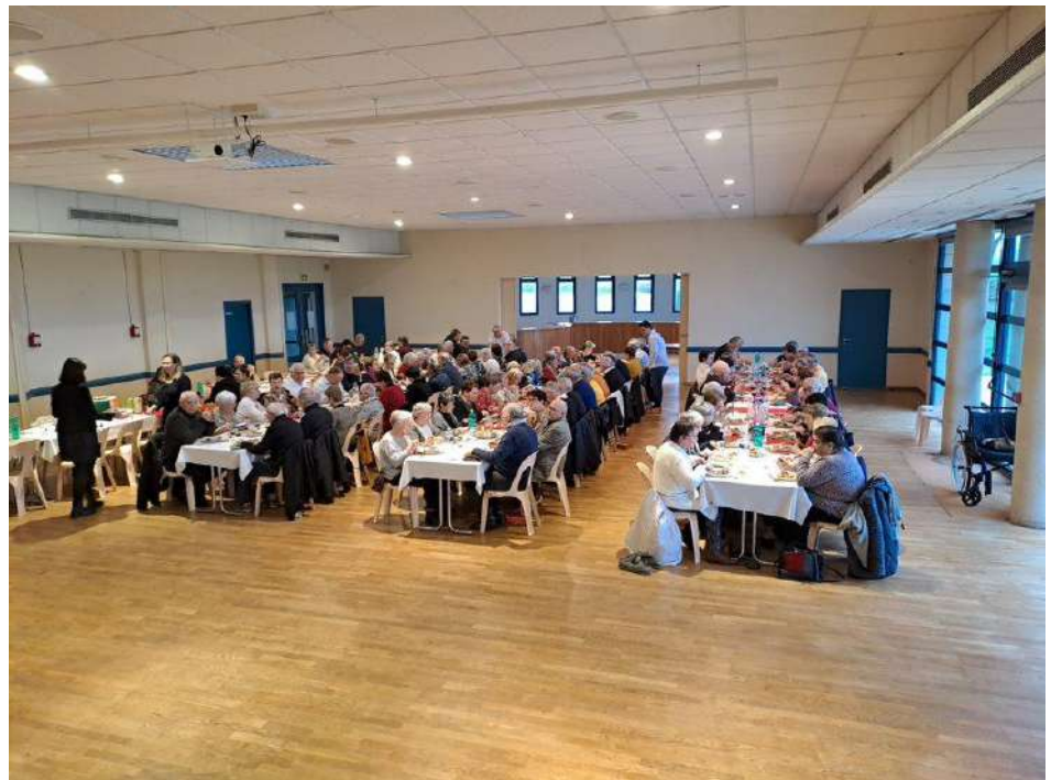
Repas des « plus de 65 ans »