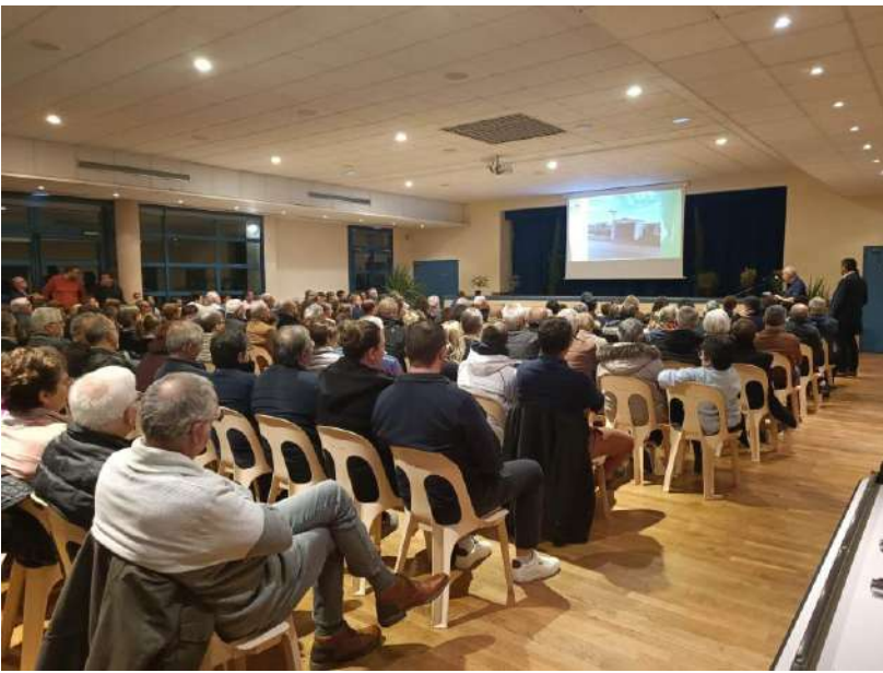
CEREMONIE DES VOEUX